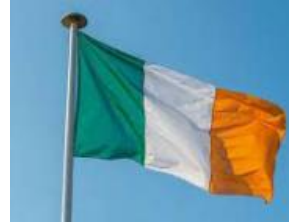
Bratach ar foluain