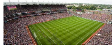
Páirc an Chrócaigh

Beidh an cluiche ceannais ar siúl ar an 24 Iúil. Go dtí le déanaí bhí an cluiche ceannais ar siúl i mí Mheán Fómhair, ach beidh buaiteoir na bliana ar eolas againn i mí Iúil i mbliana.